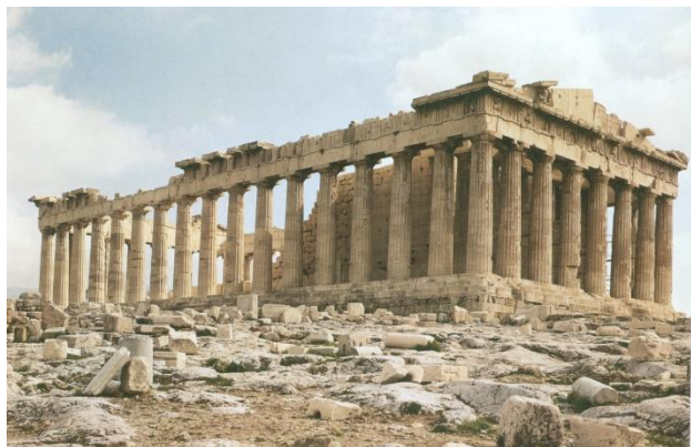
Parthenon-templet på Akropolis i Athen, påbegyndt i 446 f.Kr.

Oldtidskundskab er et humanistisk fag på C-niveau, der er obligatorisk for alle elever i gymnasiet. På Helsingør Gymnasium ligger oldtidskundskab i 3.g. Faget er mundtligt og den eneste skriftlige dimension forekommer i forbindelse med synopsis i AT.