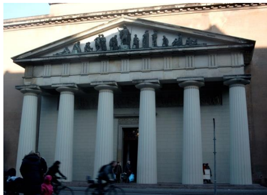
Vor Frue Kirke i København, opført 1810-1826. Arkitekt: C. F. Hansen

Læreplanens første ord lyder: »Oldtidskundskab er et kulturfag, der omhandler antikken (dvs. den græske og romerske oldtid) som grundlag for europæisk kultur.« Oldtidskundskab beskæftiger sig altså med den græske og romerske oldtid, samt med de spor denne periode har sat i den europæiske kultur.